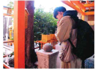
叶う願いなら軽く感じる不思議な石。