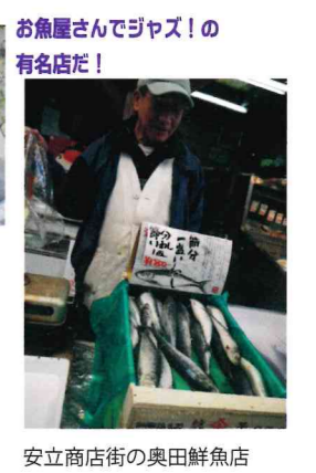
お魚屋さんでジャズ!の有名店だ!