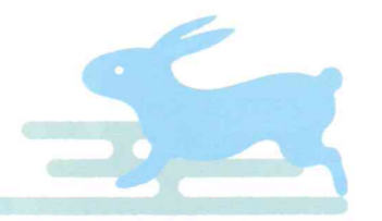
太鼓橋を渡った先の手洗舎には、清めの水を出すうさぎさんが