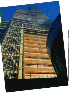
あべのハルカスを仰ぎ見る。駅周辺も年々近代的になってきました