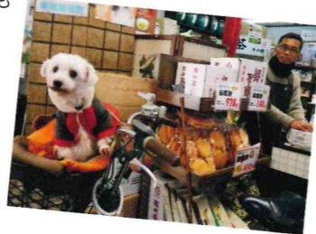
流行に敏感なワンコ(寺田園にて)