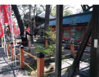
※写真真ん中のお飾りは鏡ではないので、向こう側に人が立てば見える…という事のように

ところで住吉さんのおみくじ「凶」だったよー(泣)。どこにも結べない。大歳社へ行ってみた。重軽石に願いを込めて……(どうか彼女ができますように。) 「でも、2度目の石がめっちゃ重かったんです。涙」 さ、気持ち切り替えて次へ行こう!我孫子道を超えたら堺だよ。(6ページに続く)