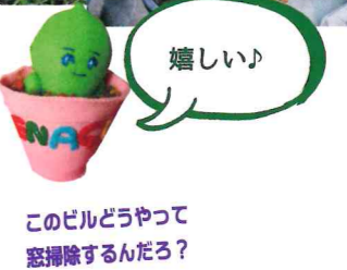
このビルどうやって怒掃除するんだろ?