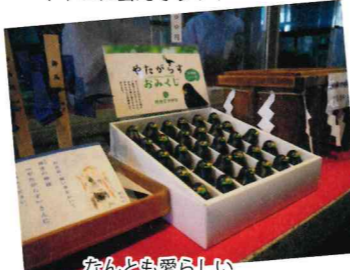
なんとも愛らしい八咫鳥(やたがらす)みくじ