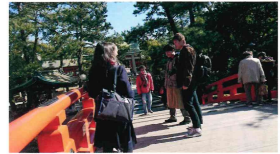
そして住吉さんといえば「うさぎ」だー!

太鼓橋にて、外国人の方に「写真撮りましょか。」と声をかける。優しいねー。彼女たちは留学生でした。24枚撮りのフィルム、そんなに使って大丈夫〜?