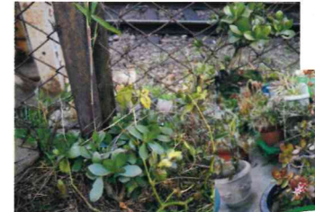
成金草 たくさん見つけたよ。