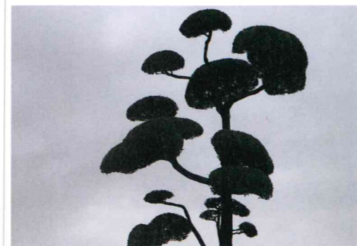
独特の生垣や、和風建築の意匠が見事です。