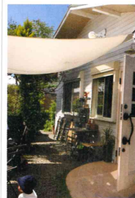
A little bit cafe

石窯ピッツアの隠れ家風カフェ。テラス席でガーデンパーティー♪ 堺市西区浜寺公園町 3-226-10 072-267-0337 11:00～20:00(休)月